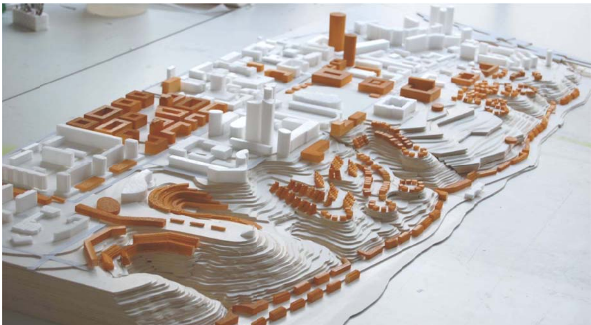
Modelo del diseño geoespacial © as&p

Se ha previsto el desarrollo de nuevas áreas residenciales y comerciales en esta orilla del río, mejorar las áreas urbanas adyacentes y desarrollar un nuevo barrio a orillas opuestas del río. El plan director geoespacial incluye el abastecimiento de agua, de energía eléctrica, gas natural, la colección de las aguas residual y pluvial y el sistema de calefacción de distrito.